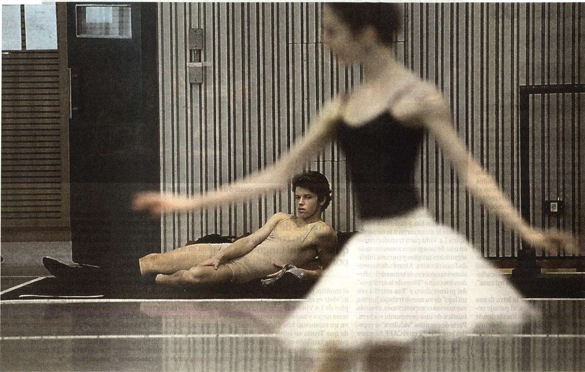
Anteayer, al mediodía, en el Teatro, ajustando detalles en los ensayos previos al estreno del martes