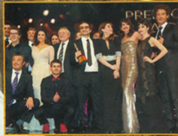
EL ORO DE GRADUADOS

LA GRAN NOCHE DE GRADUADOS TUVO PICOS DE 38 PUNTOS DE RATING